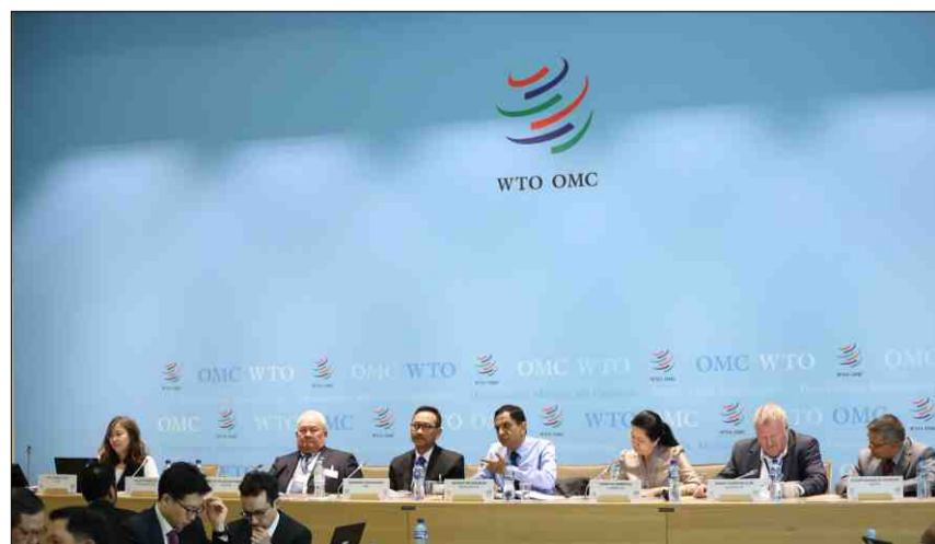
Insunter da l'Organisaziun mundiala da commerzi.

Dapli infurmaziuns: chatta.ch/?hiid=4711 www.chatta.ch